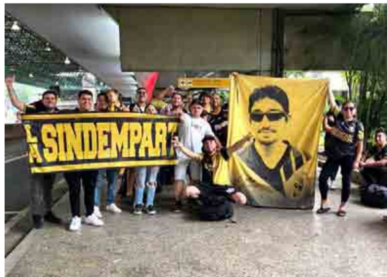
El primer viaje de los seguidores aurinegros fue a Brasil. La próxima semana se subirán a un bus para llegar a Buenos Aires por el duelo ante Racing.

Al respecto, explica que la proximidad entre los partidos de visitante, hizo que mucho tuvieron que elegir, y ganó ciertamente Buenos Aires que entrega un mejor panorama. “Mi abuelo fue quien me dio esta pasión por Coquimbo Unido y podremos estar en todos los partidos, aunque ante Racing de Avellaneda iremos con una pareja de amigos, pues nos