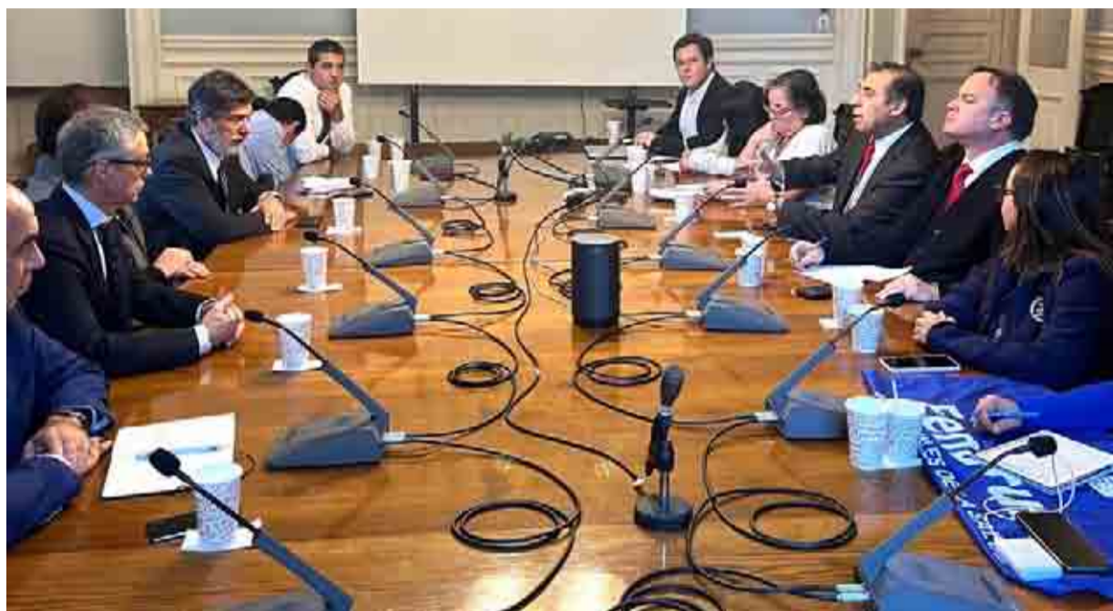
El Consejo Consultivo del Hospital de La Serena, junto a autoridades locales y parlamentarios, se reunió ayer en Santiago con la ministra de Obras Públicas, Jéssica López, y con representantes de la empresa Acciona.

Desde el MOP indicaron que se entregó una propuesta visada por Hacienda a la sociedad concesionaria, la cual se analizará durante los próximos días. Desde Acciona, en tanto, señalaron que, una vez que se apruebe la etapa 2 del diseño y se den las condiciones respectivas, será posible partir con las obras.