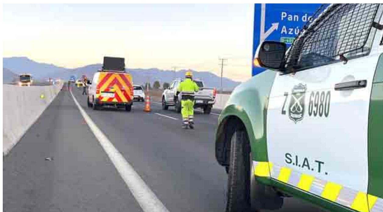
Durante la mañana de este lunes, se registró un nuevo accidente de tránsito con víctima fatal, a la altura del kilómetro 64 de la ruta 43.

Entre las principales causas, relacionadas con la irresponsabilidad de los involucrados, se encuentran la conducción en estado de ebriedad, transitar sin estar atentos a las condiciones del entorno e imprudencia de los peatones. Ovalle lidera las cifras en la región con ocho víctimas fatales en los primeros meses del año. Carabineros hizo un nuevo llamado a la comunidad a aportar en la convivencia vial.