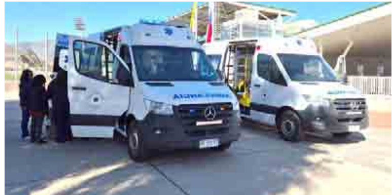
Las nuevas ambulancias vienen a atender un territorio con muchas carencias en materia de salud.

Los futuros usuarios contarán con dos nuevos móviles gracias a la inversión de más de 170 millones de pesos del presupuesto de Salud Municipal, iniciativa levantada por el alcalde de esa comuna, Jonathan Acuña y aprobada por el Concejo Municipal.